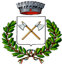
Comune di Accettura