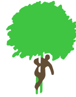
Il Maggio di Accettura